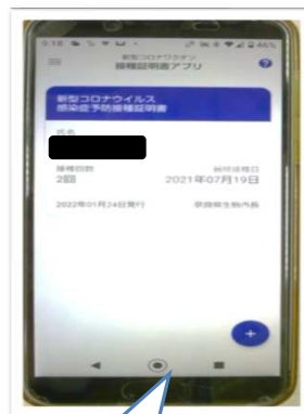
③スマホの電子接種証明書の提示

受講手続き時に、ワクチン接種証明書など、ワクチン接種済であることが確認できるものをご提示ください。